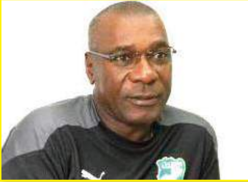
منتخب للتتويج قبل المنافسة.

ما هي العوامل التي يمكن الاعتماد عليها للتتويج بكأس إفريقيا في نظرك؟