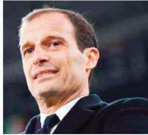
أصر ماسيميلانو أليجيري المدير الفني ليوفنتوس، على أن منصبه في يانكوتري لا يعد أولوية حالياً، مع اقتراب عقده من نهايته و ينتهي عقد أليجيري مع يوفنتوس بنهاية الموسم

المقبل في 2025، فيما تشير تقارير صحفية إلى أن النادي يتجه لعرض عقد جديد على أليجيري، تقديرا لعمله خلال العامين ونصف الماضيين وقال أليجيري خلال تصريحات لشبكة "سبورت ميدياست" الإيطالية: "ينبغي عام آخر في عقدي، وأعتقد أن منصبي ليس أولوية، الأولوية أن يظل اللاعبون هادئين لأنهم قدموا مباراة جيدة (الدبري)" وأضاف: "لقد غيروا 15 لاعبا منذ عودتي، وخفضنا متوسط العمر، والنادي أبرم تعاقداً محدوداً جداً لإعادة بناء فريق قادر على اللعب بدوري أبطال أوروبا، وهو الهدف المهم كما قبل في 3 سنوات" وتابع: "لقد فعلنا ما كان علينا القيام به، ونحاول بلوغ دوري الأبطال مرة أخرى هذا العام، آسف بشأن الخسارة لكننا بالتأكيد بحاجة للفوز مرة أخرى في لقاء أودينيزي" و خسر يوفنتوس الوصيف من إنتر ميلان المصدر 0-1، أمس الأحد، بالجولة 23 من الدوري الإيطالي، لتسع الفارق بينهما إلى 4 نقاط، وتبقى مباراة مؤجلة لإنتر.