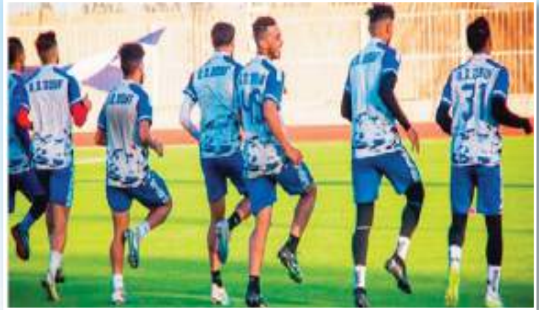
تمثل المخطط الأخيرة في مباراة تطبيقية بين عناصر التشكيلة الأساسية والاحتياطية على أن تعقد جلسة مباشرة بعد نهاية الحصة

كما كان منتظرا، وجهت الدعوة من قبل المدرب شيباني سمر لعناصر من فئة الرديف من أجل النقل مع فئة الأكاير نحو العاصمة للمشاركة في اللقاء بسبب عدم قدرة بعض