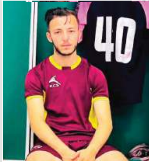
"سجلنا ثلاثة أهداف والفعالية كانت حاضرة هذه المرة"