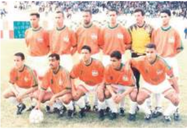
بالاعتماد على التكوين بالدرجة الأولى.