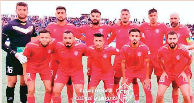
الصحة الرسمية للفريق شباب تموشنت

تختلف أرقام وإحصائيات الفريق في البطولة هذا الموسم مقارنة بالموسم الماضي، وهذا من حيث الانتصارات، الهزائم، الأهداف المسجلة وكذا الأهداف التي تلقاها الفريق في البطولة. فعلى سبيل المثال، تكبد الفريق الهزيمة خلال الموسم الماضي في مناسبتين فقط أمام كلا من أمام رائد القبة ومولودية البيض. فيما تلقت شباك "السيارتي" تسع أهداف