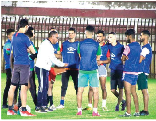
تطلعات الفريق وأنصاره. جماهير اتحاد وفاق زغلول تأمل في أن تتدخل السلطات اأخيلية للنظر في وضعية الملعب البلدي قاطفي، الذي ينتظر إعادة تهيئته ليكون جاهزاً لاستقبال المباريات مستقبلاً.

أعادته إلى صدارة الترتيب، مستغيداً من تعثر ملاحقه المباشر. هذه النتيجة عززت ثقة اللاعبين في قدرتهم على تحقيق الصعود، خاصة بعد فقدان الفرصة في آخر موسمين رغم الاقتراب منها. إدارة النادي تعمل جاهدة على توفير كافة الإمكانيات لضمان سير الفريق في أفضل الظروف، من خلال