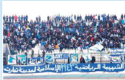
لن يسمح له المشاركة في مباراة هذا السبت. لهذا فإن الطاقم الفني للشبيبة أبدى ارتياحه لعودة جميع