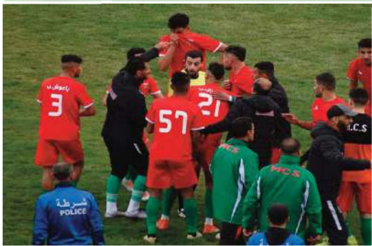
هذه الأزمة التي كثر فيها الحديث عن مصرع الفريق الذي يبقى يعاني من الشعي البلدي والجلس الشعبي الولائي من أجل تقديم يد المساعدة للفريق خاصة في ظل

عاد فريق مولودية سعيدة من ملعب 20 أوت بتعداد ايجابي حين فرضه على مضيفه فريق نصر حسين داي التعادل. ليكون الحديث مرة أخرى داخل بيت فريق مولودية سعيدة عن الصعير الأخير والمشاكل التي أصبحت توتر بشكل أو بآخر على المردود العام للفريق. المولودية عرفت كيف تحطف نقطة ثمينة من أرض منافسه. كما أن الإضراب الذي دخل فيه لاعبي فريق مولودية سعيدة يبقى من بين أهم الأسباب التي أثرت بشكل أو بآخر على المردود العام للمولودية الذي يبقى يعاني من تذبذب في النتائج، وهو ما جعل الانصاف يرمون بحمام غضبهم على إدارة الفريق. فيما يبقى الفريق لحد الساعة ينتظر لما ستفرج عنه اجتماعات المجلس