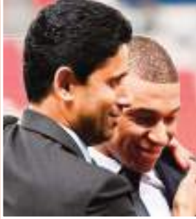
شقيق مبابي يدفع الثمن

يدفع شقيق كيليان مبابي، إيثان، ثمن انتقال الأول، الوشيك، إلى نادي ريال مدريد الإسباني في الصيف المقبل، بخروجه من عباءة باريس سان جيرمان الفرنسي. كيليان لن يجدد عقده مع باريس، ولم تعد أنباء توقيعه لريال مدريد كلاعب حر مجرد حبر على ورق، ووفقاً لشبكة ديفنسا سترال الإسبانية فإن إيثان مبابي، الذي يعتبر من أبرز جواهر قطاع الشباب في سان جيرمان، سيضطر للرحيل عن الفريق.