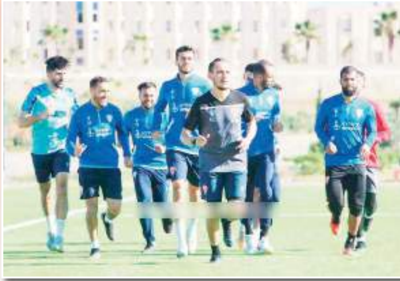
الحمراوة سيق وأن حذروا من الكوتسة

بغض النظر عن تحقيق نجم بن عكنون للفوز في مواجهة اتحاد خنشلة، فإن بعض المعطيات جعلت الشكوك تحوم حول هذه المقابلة خاصة سيناريو التسعين دقيقة والبرودة التي لعب بها السيسكاوة، بالإضافة لطريقة تسجيل أهداف نجم بن عكنون خاصة الهدف الأول وكذا الثالث والذي كانا بمثابة هديتين من دفاع خنشلة والحارس خذابيرية مما فتح المجال للعديد من التأويلات. لا يختلف إثنان على أن نتائج بعض مباريات البطولة الأخيرة خاصة تلك المتعلقة بأندية مؤخرة الترتيب باتت مشكوك فيها، خاصة وأن بعض الفرق والتي عززت عن تحقيق حتى التعادل في ملعبها في عدة مباريات في