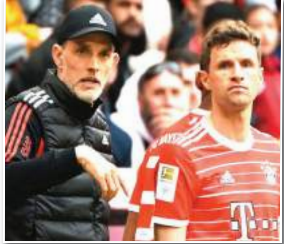
علق ماكس إيرل وكريستوف فرويند، المديران الرياضيين لبايرن ميونخ، على مستقبل المدرب توماس توخيل، بعد سقوط العملاق البافاري أمام هايدنهايم بنتيجة (3-2)، يوم السبت. وتلقى

بدوره، قال إيرل: «بالطبع سيتواجد توخيل مع الفريق في الأسابيع المقبلة.. لم أفكر في هذا الأمر (إقالته قبل مباراة أرسنال)». وأتم: «يجب علينا التأكد من التأهل لدوري الأبطال.. لكن من الواضح بالنسبة لي أنه سيتواجد في مباراة الثلاثاء، ومن بعدها أمام كولن يوم السبت».