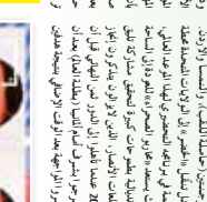
طاقم فريق كرة القدم لنادي الانفاس، 2026

طاقم فريق كرة القدم لنادي الانفاس، 2028. في إطار استعدادات النادي للتحديات المقبلة، تم تجديد طاقم الفريق. هذا التغيير يعكس التزام النادي بتحسين أدائه وتحقيق أفضل النتائج. كما تم التركيز على تطوير اللاعبين الشباب وتزويدهم بالخبرة.