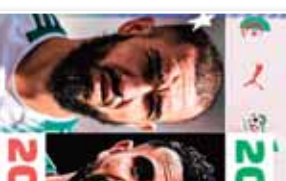
طاقم فريق كرة القدم لنادي الانفاس، 2026

ثلاثة نجوم يقتربون من توقيع «الخصم» بعد مونديال 2026. في إطار استعدادات النادي للتحديات المقبلة، تم تجديد طاقم الفريق. هذا التغيير يعكس التزام النادي بتحسين أدائه وتحقيق أفضل النتائج. كما تم التركيز على تطوير اللاعبين الشباب وتزويدهم بالخبرة.