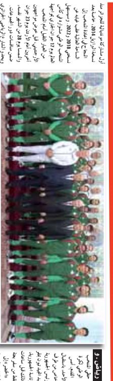
طاقم فريق كرة القدم لنادي الانفاس، 2026

الخصم في ضيافة الرئيس تبون. في إطار زيارته الرسمية للجزائر، استقبل الرئيس تبون طاقم فريق كرة القدم لنادي الانفاس. الرئيس أعرب عن تقديره لالتزام اللاعبين بالوطنية وتحقيق النجاحات الرياضية. كما أكد على أهمية الرياضة في التنمية الاجتماعية للشباب.