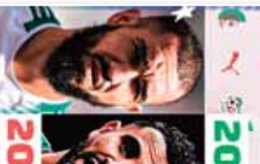
طاقم فريق كرة القدم لنادي الانفاس، 2026

طاقم فريق كرة القدم لنادي الانفاس، 2026. في إطار استعدادات النادي للتحديات المقبلة، تم تجديد طاقم الفريق. هذا التغيير يعكس التزام النادي بتحسين أدائه وتحقيق أفضل النتائج. كما تم التركيز على تطوير اللاعبين الشباب وتزويدهم بالخبرة.