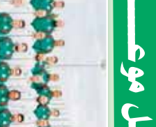
طاقم فريق كرة القدم لنادي الانفاس، 2026

الخصم في ضيافة الرئيس تبون. في إطار زيارته الرسمية للجزائر، استقبل الرئيس تبون طاقم فريق كرة القدم لنادي الانفاس. الرئيس أعرب عن تقديره لالتزام اللاعبين بالوطنية وتحقيق النجاحات الرياضية. كما أكد على أهمية الرياضة في التنمية الاجتماعية للشباب.