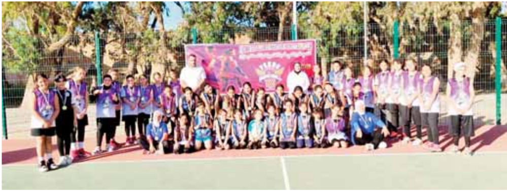
جديد من اللاعبات القادرات على تحمّل الرياضة الجزائرية بأفضل صورة.

في وقت تتزايد فيه الحاجة إلى فضاءات رياضية متخصصة تسمح للفتيات بممارسة مختلف الأنشطة الرياضية، يبرز النادي الهاوي الرياضي فدوة التميز وهران لكرة السلة كواحد من المشاريع الرياضية الواعدة التي تسعى إلى ترسيخ ثقافة التكوين القاعدي واكتشاف المواهب الشابة في عاصمة الغرب الجزائري. ورغم حداثة نشأته، استطاع النادي أن يضع لنفسه مكانة ضمن المشهد الرياضي المحلي بفضل اعتماده على العمل التكويني المنظم والاهتمام بالفئات الصغرى، حيث يفتح أبوابه أمام البنات من مختلف الأعمار السنية، بهدف تعليم أساسيات كرة السلة وصقل القدرات الفنية والبدنية