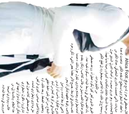
ممرضات في إحدى مستشفيات الجزائر، 2026

ممرضات في إحدى مستشفيات الجزائر، 2026. في إطار استعدادات القطاع الصحي للتحديات المقبلة، تم تجديد طاقم الممرضات. هذا التغيير يعكس التزام الوزارة بتحسين جودة الخدمات الصحية المقدمة للمواطنين.