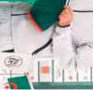
طاقم فريق كرة القدم لنادي الانفاس، 2028