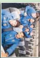
ممرضات في إحدى مستشفيات الجزائر، 2026

الجزائريين يتفقوا على الحد الأدنى للأجور بسبب الإصايب. في إطار المفاوضات الجارية بين النقابات المهنية والعمالية والجهات المعنية، تم التوصل إلى اتفاق على الحد الأدنى للأجور في مختلف القطاعات المهنية. هذا الاتفاق يهدف إلى حماية حقوق العمال وضمان معاشهم الكريم في ظل الظروف الاقتصادية الصعبة. كما تم التأكيد على أهمية الحوار الاجتماعي في معالجة القضايا العمالية.