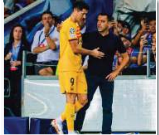
دوري الأبطال. كما يحوم شكوك حول إمكانية خاق النجم البولندي صاحب الـ 35 عاماً بمباراة الكلاسيكو ضد ريال مدريد، يوم 28 من الشهر الجاري.

وأوضحت أنه بعد تعافي رافينيا، ربما يلجأ مدرب البارسا للعب برباعي في خط الوسط، أمامهم الثاني الهجومي فران توريس وجواو فيليكس. ويعيب ليفاندوفسكي عن صفوف برشلونة لما يقرب من شهر، لإصابته بالتهوع في الكاحل، حيث سيعيب عن مباريات غرناطة وبيلباو في الدوري، واختار دونستيبك في دوري الأبطال. كما يحوم شكوك حول إمكانية خاق النجم البولندي صاحب الـ 35 عاماً بمباراة الكلاسيكو ضد ريال مدريد، يوم 28 من الشهر الجاري.