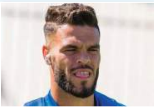
التوقف كان فرصة لمراجعة العديد من الأوراق رفقة الطاقم الفني.»

«الحمد لله منذ بداية الموسم سجلت أهداف حاسمة لفريق وسأواصل على نفس النهج إن اعتمد علينا المدرب بالطبع ولن أخجل على فريقنا بأي مجهودات في سبيل إسعاد الأنصار الذين ينتظرون منا الكثير.»