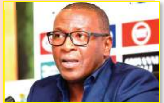
حاوره: مصطفى خليفاهي

«المواجهة لن تكون بيني و بين المدرب فقط، بل بين منتخبي موزمبيق و الجزائر، أعلم أنه سيكون هناك صراع تكتيكي بين دكتي و البدلاء كما يحدث في أي مباراة أخرى، لكن أنا لا آبه لهذا الأمر كثيرا و لا أضعه في الحسبان، شخصيا أركز على المواجهة الجماعية فهي الأمر الأكثر أهمية، لا أضغ