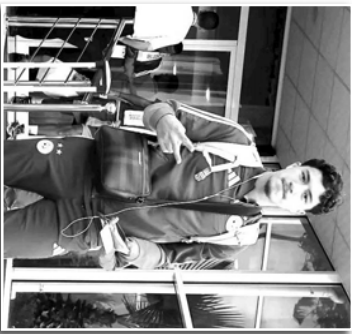
comme un élément important de son projet sportif et souhaite l'acquiescer dans un environnement compétitif et stimulant.