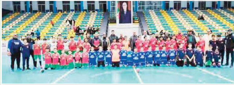
يهدف مهرجان المدارس لكرة اليد إلى نشر

ثقافة الرياضة بين الأطفال والشباب، وتشجيعهم على ممارسة النشاط البدني، لما له من فوائد صحية وتربوية. كما يسهم في اكتشاف المواهب الجديدة التي قد تصبح نواة أساسية للفرق المحلية والوطنية مستقبلاً. وقد لقيت هذه الفعالية إشادة واسعة من طرف المشاركين وأولياء الأمور، الذين عبروا عن سعادتهم بروية أبنائهم يشاركون في نشاط رياضي منظم ومفيد. كما أبدى مسؤولو الرابطة الولائية لكرة اليد رضاهم عن المستوى التنظيمي والفني الذي ميز هذه الدورة، مما يعزز مكانة وهران كمركز رياضي مهم على المستوى الوطني.