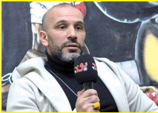
السحور، أنصح بجلسة خفيفة لمدة 20 دقيقة فقط، دون إجهاد زائد. السنوي عند العودة للمنافسات الرسمية.

كيف تقضي يومك في رمضان بين العمل والتدريب؟