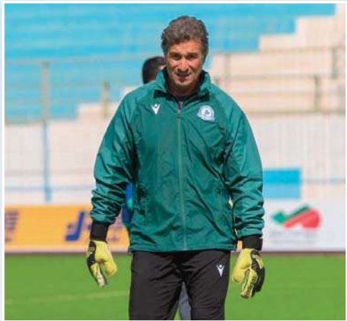
المولودية في هذه المواجهة التي لا تقبل القسمة على إثنان.