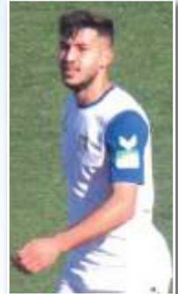
هل ستبقى موسم آخر في الشبيبة،

"نعم أملك بعض العروض المقدمة من الفرق الرابطة المحترفة، وسوف أحدد وجهي في الساعات القادمة، وترك بصمتي مع فريقتي الجديد الموسم المقبل."