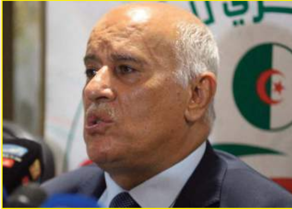
المكتب التنفيذي لإتحاد اللجان الأولمبية العربية أن يستخلص العبر ويعمل على حماية الرياضة كعناصر لتحقيق التضامن العربي. فالرياضة يجب أن تكون أحد رموز وحدتنا، ونحن في فلسطين سواء في الرياضة أو غيرها تبقى في حاجة إلى السند العربي."

تغطية: مصطفى خليفوي / وداد هاشم