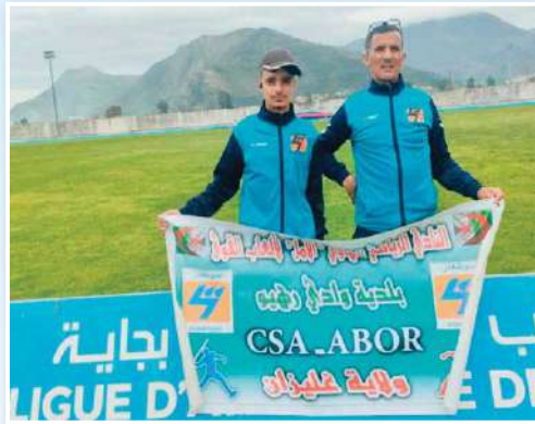
المعانة المادية لم تقف عائقا أمام مواصلة التألق

و لعل أبرز ما يؤكد أن القائمين على هذا النادي عازمون على شق طريق النجاح هو عدم اكتفائهم باختصاص واحد فقط في ألعاب القوى ، بل فتشروا المجال أمام العديد من التخصصات مثلا السرعة 60م و 80م و 100م و 120م و 150م و 200 م و 400م و 800م و 1200م و 1500م و 3000م و 5000م و 10000م و حتى نصف الماراطون ، حيث كانت آخر مشاركة في البطولة الوطنية ل نصف الماراطون بتاريخ 26 أفريل ببنيازة تحصل فيها النادي على المرتبة الخامسة حسب الفرق ، بالإضافة إلى رمي الجلة و القفز الطويل .