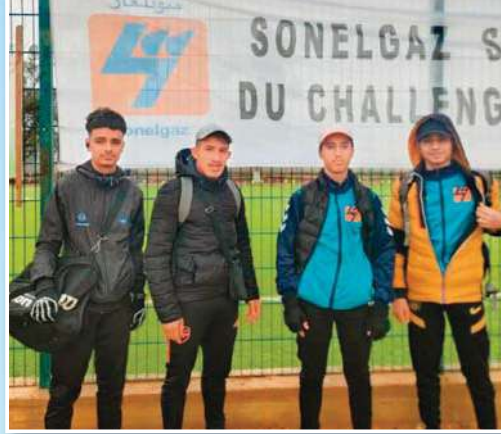
ألقاب وطنية و نتائج مشرفة لحد الآن

و إن كانت المشاكل المادية قد تسببت في فرملة تألق النادي الرياضي الهواي الأمل لألعاب القوى بواي رهيو في بعض المناسبات الوطنية ، إلا أن القائمين على هذا النادي يصرون على مواصلة