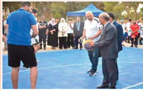
المقاييس حسب كل من تابعها من متفرجين حيث إستحسنوا مثل