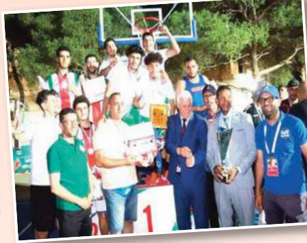
هكذا منافسات التي أضفت حركة كبيرة وسط الشارع الرياضي البيضي، خاصة

ولاية البيض ومن تنظيم مديرية الشباب والرياضة رفقة الاتحاد الجزائري لكرة السلة والرابطة الولائية لكرة السلة بالبيض وشهدت مشاركة أكثر من 14 فريق من ولايات هي البيض البلد المستضيف وتيارت وقسنطينة وميلة ومعسكر وبشار والجزائر وعنابة وسطيف وسعيدة والشلف وباتنة مختلف الفئات ذكور وإناث، حيث وبعد حفل الافتتاح الذي كان بحضور كل السلطات اخلية على رأسهم السيد الولي الذي أعطى إشارة الانطلاق وسط جمع غفير من محبي رياضة كرة السلة في المنطقة، هذا وجرت هذه البطولة بحديقة الطفولة والتي تم تهيئة ملعب هاته الرياضة التي أصبحت واسعة الانتشار في بلادنا، وبالعودة لهذا البطولة والمهرجان الذي جرى على مدار ثلاثة أيام وكان التنافس شديد بين الفرق التي أمتعت الجمهور