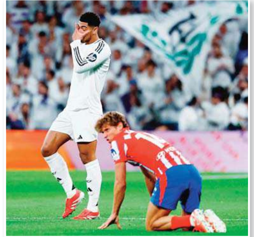
أفادت شبكة موفيستار الإسبانية بأن مدريد، شتم الحكم المساعد في مباراة ديربي مدريد، أمام أتلتيكو مدريد، التي غلب عليها الإنجليزي جود بيلينغهام، متوسط ميدان ريال

وخالف بيلينغهام القواعد المتبعة لاحترام طاقم التحكيم، بعدما احتج على رمية تماس، ظن النجم الإنجليزي أنها ينبغي أن تكون لمصلحة فريقه، إلا أن الحكم المساعد أخبره عكس ذلك. ولم يتمالك بيلبي نفسه من الغضب ليقول لمساعد جرادو «تيا لك، أيها الرجل، ابعده»، وهي كلمات كانت مفهومة للجميع، بما في ذلك معلقني موفيستار بسبب قرب بيلينغهام من الميكروفون عند خط التماس. وأفاد المعلقون وقتها بأن كل ما قاله بيلينغهام تم فهمه بصورة واضحة، علماً بأن اللاعب نال عقوبة الطرد في واقعة مشابهة في ملعب المستايا، بالوسم الماضي، في مواجهة فالنسيا، إلا أنه لم يلق أي عقوبة في هذه المرة.