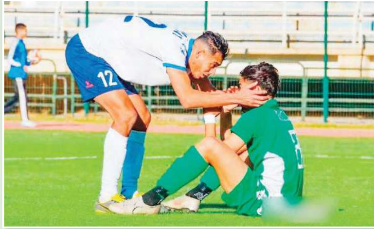
و يتحول الفريق إلى ساحة فوضى بعدم فيها الاحترام و تدعم معها الروح الرياضية.

تطلب محاربة ظاهرة الشتم في الملاعب تدخلا جادا من السلطات الرياضية والأمنية على حد سواء، إذ ينبغي تطبيق عقوبات صارمة على كل من يثبت تورطه في السب أو الشتم سواء كان لاعبا أو مدربا أو حكما أو مشجعا، كما يمكن أيضا اتخاذ إجراءات مثل منع الجماهير المخالفة من دخول الملاعب لفترات طويلة و فرض غرامات مالية كبيرة على الأندية التي لا تضبط سلوك جماهيرها. تبقى حادثة اعتذار زين الدين زيدان بعد نطحه