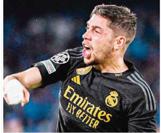
وصل الأوروغوياني فيدي فالفيدي، نجم وسط ريال مدريد، إلى مباراته رقم 200 مع رايو فايكانو. واستقبل ريال مدريد نظيره وايو

فايكانو، يوم الأحد، على ملعب سانتياجو برنابيو، في الجولة 27 لليجا، وفاز عليه بهدفين لهدف. وحقق فالفيدي، الذي خاض قبل أيام قليلة مباراته رقم 300 بقميص ريال مدريد في كل المسابقات، 137 انتصاراً في المسابقة المحلية. وفاز فالفيدي بلقب الدوري الإسباني في 3 مناسبات (2020 و2022 و2024) منذ انضمامه إلى ريال مدريد قبل 7 مواسم. وعلى مدار هذه المباريات الـ200، فإن أكثر الفريق التي واجهها في البطولة هي برشلونة وأتلتيكو مدريد وفياريال (12 مرة)، أما الموسم الذي خاض فيه أكبر عدد من المباريات فهو الموسم الماضي بواقع 37 مباراة.