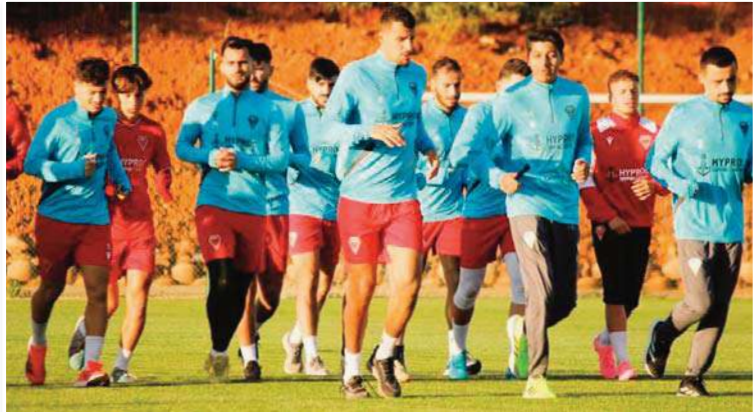
للمجموعة ككل لهذه المباراة الخاصة، التي

يدرك الحمراوة مسبقا بأن مهمتهم في تحقيق الفوز أو التعادل بملاعب آيت أحمد لن تكون سهلة على الإطلاق وذلك بالنظر لصعوبة الأمور، خاصة وأن المنافس يتواجد في أفضل أحواله بعد النتائج الإيجابية المحققة في جولات الأخيرة وآخرها التعادل في قسنطينة وطموح تشكيلة المدرب الألماني زينباور في المنافسة على السوبركوب، وهذا ما يجعل كل المؤشرات توحى بأن مهمة أشبال المدرب عمراني ستكون صعبة كثيرا.