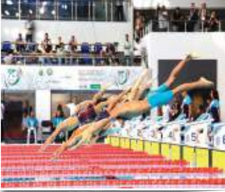
تغطية: مصطفى خليفاوي / وداد هاشم

وكان أبرزها الثنائية الذهبية لجواد صيود في تخصصي 50 متر سباحة حرة، و 400 متر تنوع، فيما حطفت آمال مليح ذهبية 50 متر سباحة حرة، وحقت مجاهد تسريين ذهبية 100 متر فراشة، وفضية 50 متر