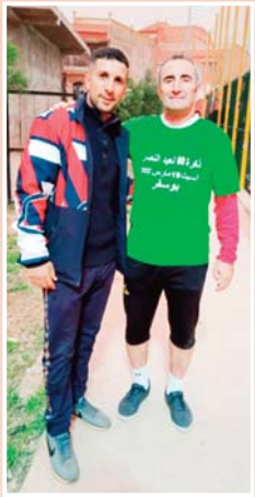
كيف تم الإتصال بك؟

"جميع النوادي أو الجمعيات التي عملت فيها كان إتصالهم بي سهلا، عبر أحد الأصدقاء أو المتابعين لصفحتي."