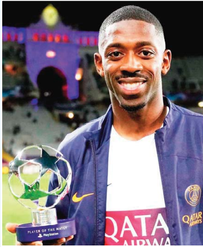
يحاول عثمان ديمبلي، نجم باريس سان جيرمان ومنتخب فرنسا، تغيير انطباع الجماهير عنه خلال منافسات الموسم الجاري. قال ديمبلي عقب الفوز (2-0) على بلجيكا في دوري أمم أوروبا: "تسجيل هدف أمر رائع للغاية. لقد قررت تسديد الكرة في الرمي عندما نسحت لي فرصة التسديد". وأضاف عبر قناة "TF1" الفرنسية: "يقول الناس عني أنني كريم للغاية، وأحاول تحرير الكرة لزملائي دانما. قررت أن أنتهز الفرصة، وسأحاول هذا الموسم أن أجرب حظي أكثر. لقد قررت أن أكون أكثر اهتماماً بنفسى". وأشار لويس إنريكي مدرب بي إس جي بقول لي دائماً جرب حظك، وأتدرب كثيراً هذا الموسم على إنهاء الهجمات في كل حصة تدريبية". واعترف ديمبلي: "عندما أراوغ لاعبا أو اثنين، أفقد للدقة في التسديد". في سياق آخر، أكد عثمان ديمبلي أن الأجواء كانت متوترة بعد الخسارة أمام إيطاليا (1-3) يوم الجمعة الماضي. وأتم ديمبلي تصريحاته "في كرة القدم هناك دائماً خظات سيئة، والخسارة أمام إيطاليا كانت بمثابة صدمة لنا".