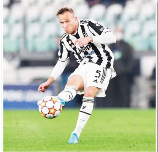
المدرّب تياجو موتا.

الانتقالات فابريزيو رومانو فإن يوفنتوس سيظل منفتحاً لفكرة بيع أرتو ميلو في حالة وصول عرض مناسب. ولكن في حالة عدم التوصل لعرض مناسب فإن يوفنتوس يخطط للاستفادة من خدماته هذا الموسم، خاصة أنه في قائمة الفريق المشاركة في نسخة هذا الموسم في دوري أبطال أوروبا. وأشار رومانو إلى أن أرتو يحضر نفسه للمنافسة بقوة على مكان في تشكيلة الفريق، ويرغب في تقديم أفضل ما لديه. ويبلغ أرتو ميلو من العمر 28 سنة، ويعيد اللعب في مركز لاعب الوسط الدفاعي، وبتنهي تعاقد مع يوفنتوس في جوان 2026. ولعب أرتو ميلو بقميص يوفنتوس في 63 مباراة في كافة المسابقات، سجل فيهم هدفاً. وصنع مثله، وتملك في رصيده الدوري 22 مباراة مع منتخب البرازيل الأول.