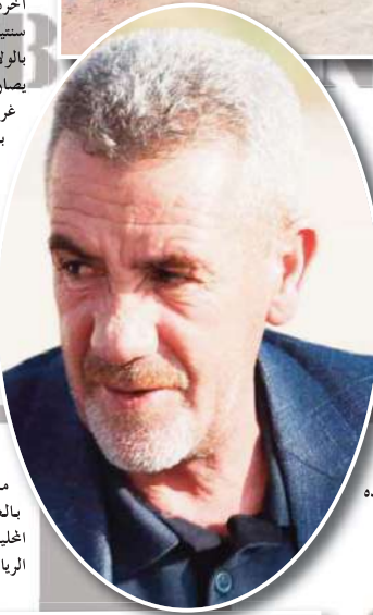
الإستفادة منه ورجحه للعمل فوق الميدان.