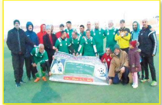
لاجراء المباراة النهائية وإحتتام الدورة.

أجواء الدورة إتسمت بالإثارة فوق المستطيل الأخضر وإشهاد التنافس، حيث تمت الحضور بفنيات عالية ومستوى كبير رغم كبر السن ونجواب الجميع مع الأداء المقدم. نشط اللقاء النهائي كل من فريق السواكروية مفتاح من ولاية البلدية وفريق أكواسيرنس من بوحنيضية، حيث عاد للقب للفريق الأول بركلات الترجيح بعد نهاية اللقاء بالتعادل هدف لكل فريق. إذ كان يمثل ولاية معسكر متقدم في النتيجة بهدف لصفر من توقيع المنائق