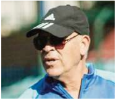
أنصار ومحبي شبيبة الساورة.