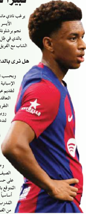
الظهير الأيسر، وينتهي تعاقد مع برشلونة في جوان 2028

وبحسب تقرير نشرته صحيفة إل ناسيونال الإسبانية فإن نادي مانشستر يونايتد مُستعد لتقديم عرض قيمته 40 مليون يورو من أجل التعاقد مع بالدي الصيف المقبل. وأشار التقرير إلى أن مُدرب مانشستر يونايتد روي مورير يرى بالدي خياراً مثالياً لتدعيم مشروعه في مانشستر يونايتد. ويرى مورير أن بالدي سيسمح للفريق ميزة إضافية لا يقدمها لاعبو الفريق الحاليين مثل ليساندرو مارتينيز ولوك شاو، وذلك بالنظر لسرعته وقدراته الهجومية وصلابته الدفاعية. وسُجِّب شهر الصيف عن السؤال بشأن قدرة يونايتد على حسم الصفقة رغم تمسك برشلونة المتوقع بالنجم الشاب. ويُعد بالدي عَصراً أساسياً في مشروع برشلونة الذي يقوده المُدرب الألماني هانز فليك. ويبلغ بالدي من العمر 21 سنة، ويُجيد اللعب في مركز