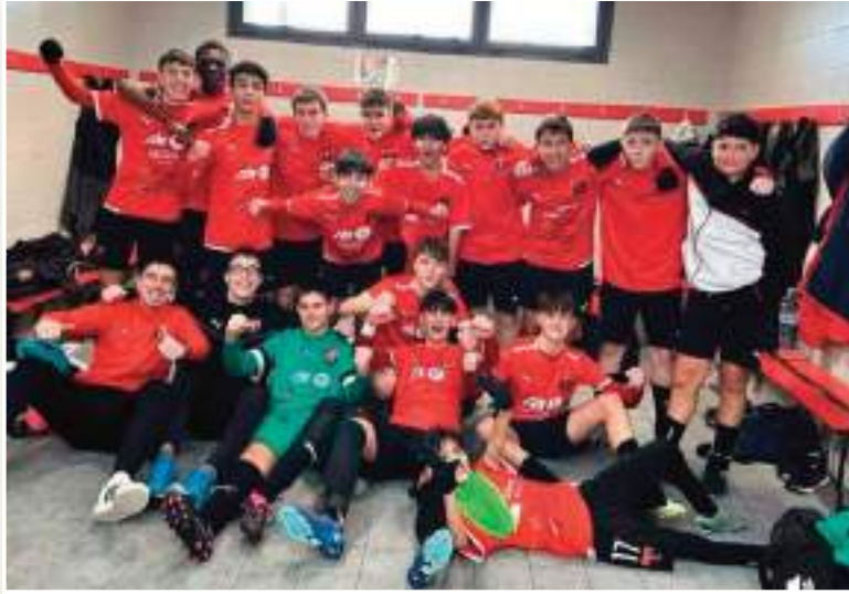
المعجرات، و أتمنى التوفيق لكل اللاعبين في الجزائر.»

كل المحمودات التي تقوم بها صح رمضان كل الشعب الجزائري و ان شاء الله يجوز علينا بالصحة و الهناء و بالتوفيق لكل اللاعبين في مشوارهم الرياضي.»