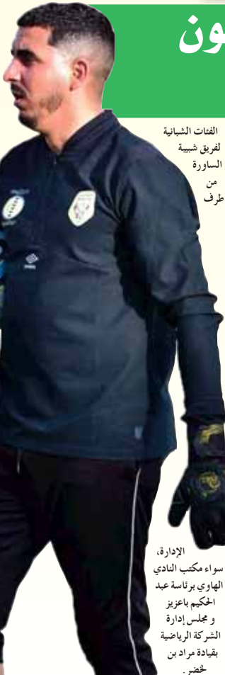
الفئات الشبانية لفريق شبيبة الساورة من طرف