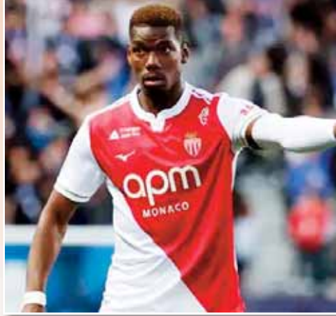
دخول نجم مانشستر يونايتد السابق إلى الملعب، سجل لوكا كولوشو هدفاً ليكمل الهزيمة الساحقة ويضع المباراة بعيداً عن متناول الضيوف.

التغلب على فترة التوقف عن اللعب بسبب الإصابة المحيطة كان طريق العودة إلى اللياقة البدنية صعباً بالنسبة للاعب يوفنتوس ومانشستر يونايتد السابق. فقد تأخرت عودته إلى صفوف الفريق الأول عدة مرات بسبب مضاعفات إصابة في ريلة الساق لم تنته. وعلى الرغم من غيابه الطويل، فإن بوجبا يحظى بالدعم للعب دور «هام» في المرحلة الأخيرة من الموسم. وقد أظهر لاعب الوسط مؤخرًا علامات على التحسن، حيث تم ضمه إلى تشكيلة المباراة التي فاز فيها الفريق 2-1 على مرسييا الأسبوع الماضي. ورغم أنه لم يشارك في تلك المباراة، إلا أن ظهوره القصير ضد باريس إف سي يشير إلى أنه أصبح جاهزاً أخيراً للمساهمة مع دخول موناكو مرحلة حاسمة من موسم الدوري الفرنسي.