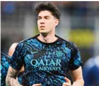
رفض أليساندرو باستوني، مدافع إنتر ميلان، فكرة الرحيل عن الفريق من أجل الانضمام إلى برشلونة خلال فترة الانتقالات الصيفية المقبلة، بعد أن أشارت تقارير صحيفة