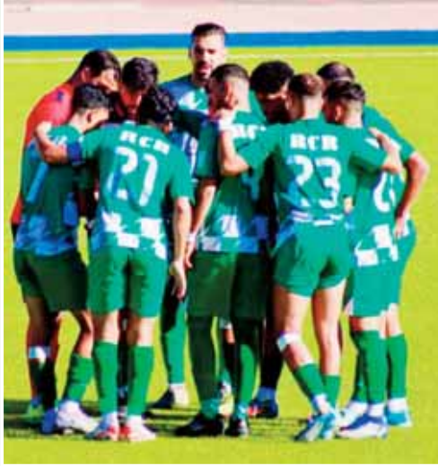
سباق الصعود يشتعل قبل 4 جولات ازدادت حدة المنافسة في مقدمة الترتيب بعد نتائج الجولة السادسة والعشرين حيث لم يعرف السباق أي تغيير في المعطيات ما نقل التشويق