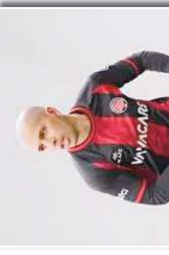
علي بن عبد الوكيل، الذي شارك في بطولة كأس العالم لكرة القدم في قطر 2022.

كانت بطاقة اللاعب الإنجليزي الشاب جون ألكوك من ضمن أفضل اللاعبين على جائزة أفضل لاعب شاب في البريمير ليغ لهذا الموسم، والتي تلقت من اسم النجم الجزائري الشاب علي بن عبد الوكيل، الذي شارك في بطولة كأس العالم لكرة القدم في قطر 2022، وحصل على جائزة أفضل لاعب شاب في البريمير ليغ لهذا الموسم. وكان علي بن عبد الوكيل قد لعب في 11 مباراة وسجل 3 أهداف، مما جعله يحتل المركز الثاني في قائمة أفضل لاعبي البريمير ليغ لهذا الموسم. أما النجم الجزائري الشاب علي بن عبد الوكيل، فقد لعب في 10 مباريات وسجل 2 أهداف، مما جعله يحتل المركز الثالث في قائمة أفضل لاعبي البريمير ليغ لهذا الموسم.