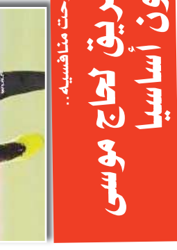
إدارة نادي فينورد الهولندي، التي أعلنت عن خططها لتدعيم صفوفها في الموسم المقبل.

كانت إدارة نادي فينورد الهولندي قد أعلنت عن خططها لتدعيم صفوفها في الموسم المقبل. وقد أعلنت عن خططها لتدعيم صفوفها في عدة مواقع، خاصة في خط الوسط. وقد ذكرت أنها ستعمل على جذب لاعبين ذوي جودة عالية، خاصة من الجزائر، حيث يوجد عدد كبير من الجزائريين في صفوف النادي. وقد ذكرت أنها ستعمل على جذب لاعبين من الخارج، خاصة من الجزائر، حيث يوجد عدد كبير من الجزائريين في صفوف النادي. وقد ذكرت أنها ستعمل على جذب لاعبين من الخارج، خاصة من الجزائر، حيث يوجد عدد كبير من الجزائريين في صفوف النادي.