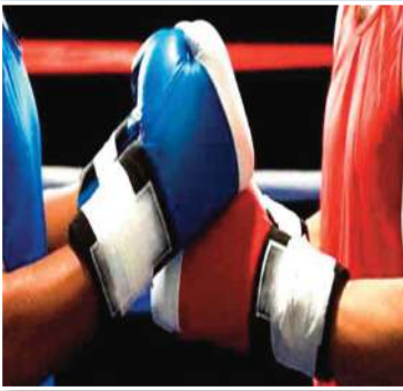
أعلن الاتحاد الدولي للملاكمة، يوم الاثنين، عن اتهامه وزير الرياضة البولندي بالعصيرية، عقب دعوات الأخير لطرده اتحاد الملاكمة الدولي من اللجنة الأولمبية الدولية بسبب قبول الروس في المنافسات الدولية خلال الفترة المقبلة. ووصف الاتحاد الدولي للملاكمة سلوك وزير الرياضة البولندي كميل بورتيتشوك بـ"غير المقبول"، مضيفاً: "تؤمن رابطة المحترفين في اتحاد الملاكمة الدولي أن الرياضيين ليسوا مقسمين إلى جيد وسيء، ودونين أم لا.. بالنسبة لاتحاد الملاكمة الدولي، كل ملاكم هو معنا دون تمييز، ورياضيونهم الأصول الرئيسية للملاكمة العالمية".