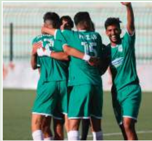
بالع سفيان المبقاء في صدارة الترتيب العام الجديدة، فالنقاط الثلاثة ستضمن لرفقاء القائد

ومما لا شك فيه فإن مباراة الجمعية غدا أمام رائد القبة لن تكون سهلة على الإطلاق، وهذا أمام منافس عنيد يتوقع له أن يلعب الأدوار الأولى، وعلى الرغم من تعثره داخل القواعد في المباراة الأولى إلا أنه تدارك الأمر في الجولة الثانية وحقق النقاط الثلاثة داخل قواعد أيضا، ولهذا فإن الأرسىكا سيبحث لا محالة عن التأكيد والعودة بنتيجة ايجابية من عرين لازمو في أول لقاء له خارج الديار، كما