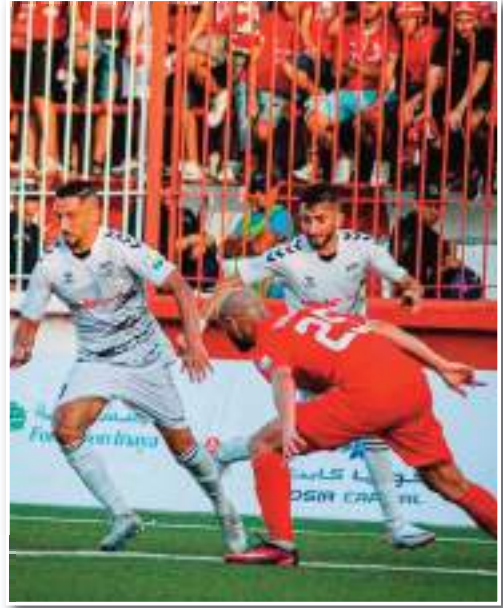
سيكون الموعد يوم غد مع تسوية رزنامة إجراء مواجهتين، حيث يحل حامل لقب الرابطة المحترفة الأولى لكرة القدم من خلال الدوري الجزائري خلال المواسم الأربعة