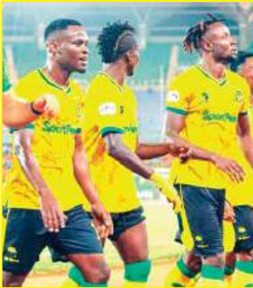
ماهي أهداف نادي يونغ أفريكانز في دوري أبطال إفريقيا هذا الموسم؟

"نريد أن نترك بصمتنا في كرة القدم الإفريقية، نريد الفوز بدوري الأبطال، لقد تعاقدنا مع العديد من اللاعبين الممتازين والموهوبين، ونملك ذكوة جيدة جداً وذوي خبرة كبيرة استعداداً للمنافسة والفوز بهذه الكأس التي تبقى هدفاً الأول، وصلنا الموسم الماضي إلى نهائي كأس الكونفيدرالية الإفريقية وكنا قاب قوسين أو أدنى من العودة بها إلى تانزانيا، ولكن الأهداف كبرت وهذه المرة نريد الفوز بدوري الأبطال ونملك كل الإمكانيات لتحقيق ذلك."