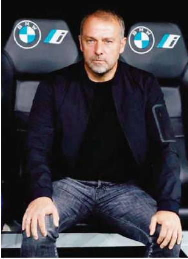
علق هانسي فليك، المدير الفني

لفريق برشلونة، على المقارنات التي تجرى بينه وبين المدرب السابق للنادي، تشافي هيرنانديز، حيث قال: "ليس من العدل مقارنة عملي بعمل تشافي، لدي أقصى درجات الاحترام له لأنه