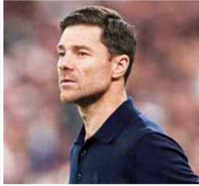
وفي الشوط الثاني كانت المباراة متقاربة، سجلوا هدفا واحظ لم يقف بجانبنا، وحوالنا التعادل لكن لم

وبخصوص أداء فينيسيوس جونيور، قال ألونسو: "الهدف كان استثنائيا، والضرر الذي سببه على الطرف كان كبيرا، الفريق عمل بجهد، قدمنا كل ما لدينا لكن لم يكن يوما". واحتتم حديثه عن كيفية تجاوز الخسارة قائلا: "علينا طي الصفحة في أسرع وقت ممكن، هذه مباراة وهذه بطولة، وهي الأقل أهمية بين البطولات التي نشارك فيها. يجب أن ننظر إلى الأمام، نستعيد اللاعبين، نعيد شحن العنويات ونواصل العمل".