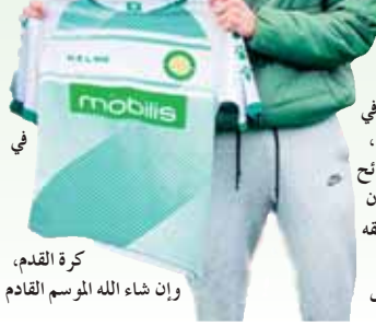
كرة القدم وإن شاء الله الموسم القادم

الملاعب وأساعد الفريق، سواء بالأهداف أو الأداء. إستطعت تسجيل 9 أهداف وتقديم 7 تمريرات في 11 مباراة، والأؤكد أن هناك دائما مجال للتحسن لأنك مع مدرب يفهم