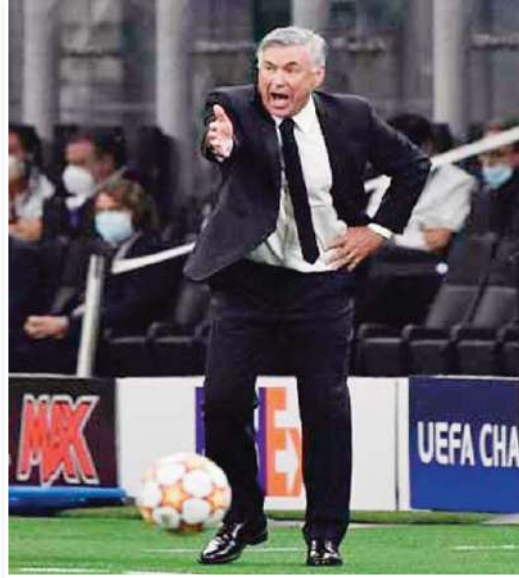
تدريبية". ويتبع جمهور ريال مدريد الشعور بالغضب من الهزيمة خاصة ان الفريق خسر قبل شهرين تقريبا على أرضه أمام برشلونة أيضا بنتيجة 0-4.

تواصل ردود الفعل الغاضبة في أوساط مُشجعي ريال مدريد بعد الهزيمة التاريخية أمام الغريم التقليدي برشلونة بنتيجة 2-5، وذلك في نهائي كأس السوبر الإسباني. وسجل خماسية برشلونة على أرض ملعب الجوهرة المشعة في جدة كل من رافينيا هذين وهدف لكل من لامين يامال وروبرت ليفاندوفسكي وأليخاندرو بالدي، فيما سجل هدفي ريال مدريد كل من كيليان مبابي ورودريجو.