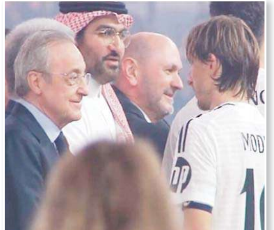
الفتحت الكاميرات لقطة بين فلورنتينو بيريز ورئيس نادي ريال مدريد، ونجم الفريق لوكا مودريتش، عقب الخسارة بنتيجة (2-5) أمام برشلونة، مساء يوم الأحد، ضمن نهائي كأس

السوبر الإسباني، ملعب الجوهرة المشعة في جدة بالمملكة العربية السعودية. والتفتت كاميرات موفستار ما قاله فلورنتينو بيريز للقائد لوكا مودريتش أثناء تسليم الميداليات. وقال رئيس ريال مدريد للكراتو مازحا: "علينا أن نخسر نهائيا يوما ما، أليس كذلك؟". وهذه هي المرة الثانية التي يفوز فيها برشلونة باللقب بالنظام الجديد (المكون من 4 فرق) بعد تنويجه بنسخة 2023. يشار إلى أن ريال مدريد يحل في المركز الثاني خلف برشلونة في عدد مرات الفوز بالسوبر الإسباني برصيد 13 لقبا، مقابل 15 للكتالونيين.