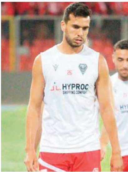
«شيل عرف كيف يحررنا نفسيا»

لاعب اتحاد الحراش سابقا اشاد بللمسة المدرب الجديد الفرائكو مالي ايريك سبيكو شيل خاصة من الناحية النفسية وقال : «لمسة المدرب الجديد شيل كانت واضحة خاصة بعد العمل الكبير الذي قام به من الجانب البيسكولوجي حيث نجح في تحرير نل من الضغط الذي طان مفروضا علينا وذلك ما تجسد في ظهورنا في الشوط الأول . انا متأكد بأن المولودية ستعود بقوة مع المدرب الجديد ونحن من جهتنا سنقدم كل ما لدينا حتى نساعد للنجاح في مهمته.»