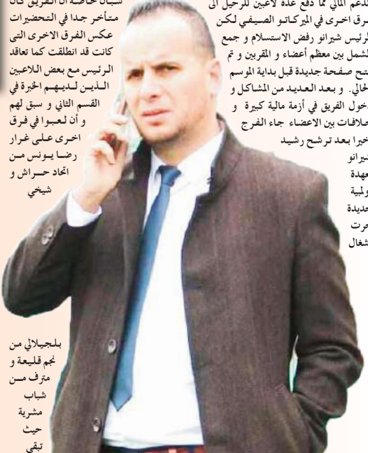
بلمجلائي من نجم قليعة و مترف من شباب مشربية حيث بقي

منظما حدث في السنوات الأخيرة وقبل بداية الموسم الحالي عمل الرئيس شيرانو على توفير كل شيء لوضع اللاعبين في أحسن الظروف من أجل تحقيق بداية جيدة في الدوري حيث خاض الفريق تربصه في تكجدة مما سمح للاعبين بتحضير في أحسن الظروف والاحتكاك بعدة فرق قبل بداية المنافسة ولعل الشيء الإيجابي هو أن الرئيس شيرانو دائما ما يبذل الغالي والنفيس من أجل وضع فريقه في السكة الصحيحة قبل بداية البطولة لتحقيق أحسن انطلاق « يبقى طموح الجميع في فريق مستقبل واد سلي هو تحقيق صعود تاريخي إلى الاعتراف الأول مع نهاية الموسم الحالي لكن الصعود يتطلب الكثير من الدعم المادي للمواصلة إلى غاية آخر جولة ومقارعة