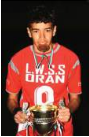
جدا و أتمنى ان أكون ضمن المنتخب الوطني

«حاليا أنا أركز على التدريبات والتضحية رفقة فريقي وأطمح لتطوير مستواي أكثر حتى أضمن مكانة أساسية، خاصة بعدما تمكنت من التألق في آخر المباريات التي اتعمد فيها المدرب علي، ولهذا أزرع في تقديم الأفضل لزملائي من خلال المساهمة في الفوز للفريقي، وبعدها يأتي التفكير في المستقبل، لأنه من دون شك طموح كل لاعب في المستقبل.»