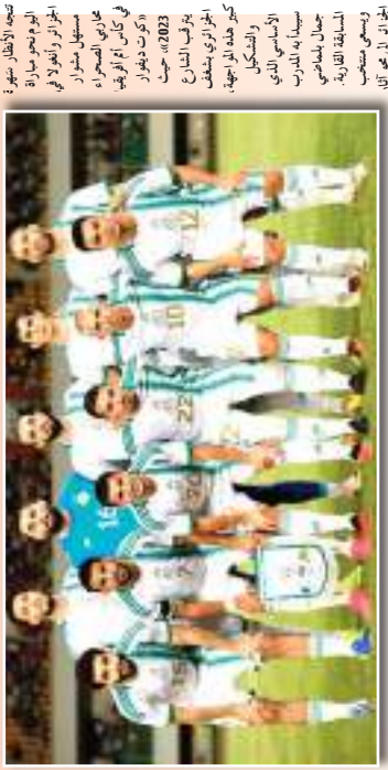
استديو (واحد) خليل بلطون كأس أم إفريقيا، حيث شاركوا في المباراة يوم 21:00 ساء. هذا هو الفريق الذي سيواجه الجزائر في المباراة.

كأس إفريقيا 2023 الجزائر VS أنغولا (اليوم 21:00 ساء)