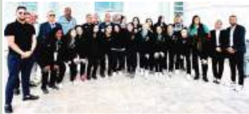
والبارزة على مستوى القارة

"السوبر" الإفريقي وكذا البطولة الإفريقية الـ 40 للأندية أبطال الكؤوس . ويعد فريق "بي أم سي" نادي معني بالمنافستين يصل إلى وهران بعدما عوض نادي "سبورتينغ" المصري في كلتا المسابقتين اثر اعتذار الأخير عن عدم المشاركة "لأسباب مالية"، حسبما علم لدى المنظمين ويواجه نادي "بي أم سي" الكونغولي نظيره الأهلي المصري في أول مباراة لحساب كأس "السوبر" يوم 15 في نصف نهائي هذه المنافسة التي ستعرف مشاركة أيضا كلا من "جي أس كي" من الكونغو الديمقراطية والمالك المصري اللذين سينشطان نصف النهائي الثاني، النادي الكونغولي سيكون حاضر في السوبر بفريق الرجال وهو الآخر حل بوهران ولاقي ترحيب كبير من اللجنة المنظمة والمسؤولين فور حلوله وهران . كما ستلعب المباراة النهائية في اليوم الموالي، ليفسح المجال بعد ذلك