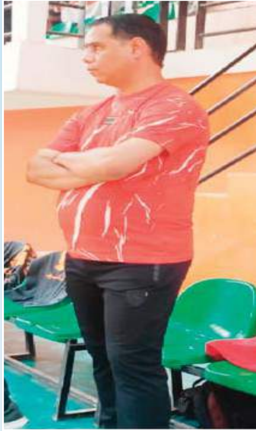
الميدان خدمة لناديهم.

«صراحة لم نستفيد من مساعدات مالية بالشكل الذي كنا نطمح إليه من