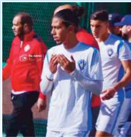
الصحيحة فعلى الجميع تقديم الإضافة اللازمة، لإخراج النادي من هذه الأزمة.

في هذا السياق فقد تمني لاعب الزرقاء أن يحل مشكل الديون قريبا حتى يتحرر الفريق: "كما قلت فإن مشكل الديون هو أكبر عائق بالنسبة للوداد ولهذا نتمنى أن يتم حله حتى يتحرر الفريق من كل مشاكله، ولهذا فعلى جميع الأطراف الاتحاد والتكاتف لإخراج الفريق من الأزمة".