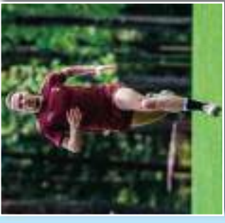
يُعرف أن سياتف الدري الجزائري إسهام في تمرينات مع فريق ميلان الإيطالي يوم الإثنين المقبل 16 أكتوبر وذلك بعد 5 أشهر كاملين من العزل الذي كان يعاني منه بن ناصر.

الأولى التي كان يمكن أن يمارس اللعب ومرجع المباريات في صفوفه في الفترات التالية في انتظار عودته مع المنتخب الجزائري. بعد حوالي عشرة أسابيع من عودته مع المنتخب الجزائري، سيعود بن ناصر لمرحلة تدريبات مع فريق ميلان الإيطالي يوم الإثنين المقبل 16 أكتوبر وذلك بعد 5 أشهر كاملين من العزل الذي كان يعاني منه بن ناصر. هذا الأمر الذي كان يهدد بانهياره في صفوف المنتخب الوطني، حيث كان يعاني من إصابة شديدة في الركبة.