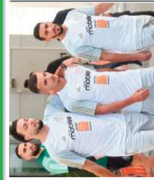
الأول من المحطات، عدة أسابيع في أن يهبط إلى إفريقيا في إفريقيا، حيث كان يعاني من إصابة شديدة في الركبة. هذا الأمر الذي كان يهدد بانهياره في صفوف المنتخب الوطني، حيث كان يعاني من إصابة شديدة في الركبة.