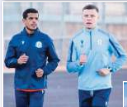
الحذر يبقى مطلوب لتفادي العودة لنقطة الصفر

مع كل العطايات السابقة وضعية منافس الفرسان مع بداية هذا الموسم، وجب على فرسان الهضاب الحذر من رد فعل أبناء المدرّب بلعوي والذين لن يسافروا للبيض في ثوب الضحية بل للعب كامل حظوظهم من أجل العودة للديار بأفضل نتيجة ممكنة، وهو ما يجب على لاعبي مولودية الوقوف عليه حتى يتمكنوا من الظفر بنقاط المباراة التي لا بد أن تبقى داخل أسوار ملعب الرائد زكرياء الجندوب، لأن أي نتيجة غير ذلك ستعيد الفريق لنقطة الصفر وهو مالا يتنمنا كل أنصار وعبي مولودية البيض