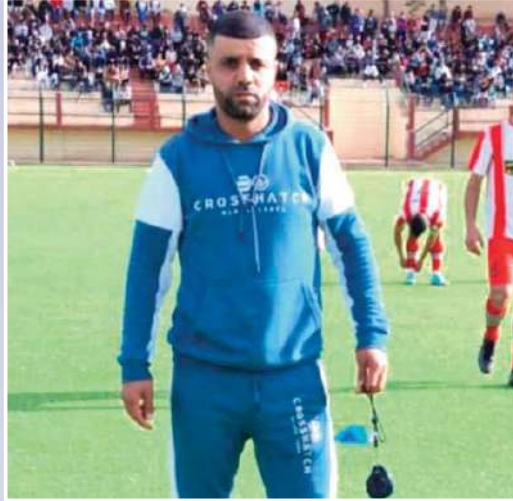
وصلاة التراويح والتدريبات بصفة عادية.

«الفريق الذي أشجعه على المستوى المحلي هو نادي مولودية الجزائر ، أما على الصعيد العالمي ريال مدريد دون أن