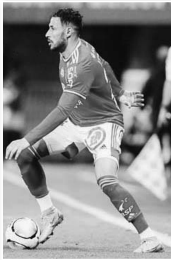
تجاوز الدولي الجزائري، يوسف بلايلي، صدمته الأخيرة بعد فشل المنتخب

الوطني في التأهل لكأس العالم 2022. وعاد بلايلي متأخراً لناديه بريست