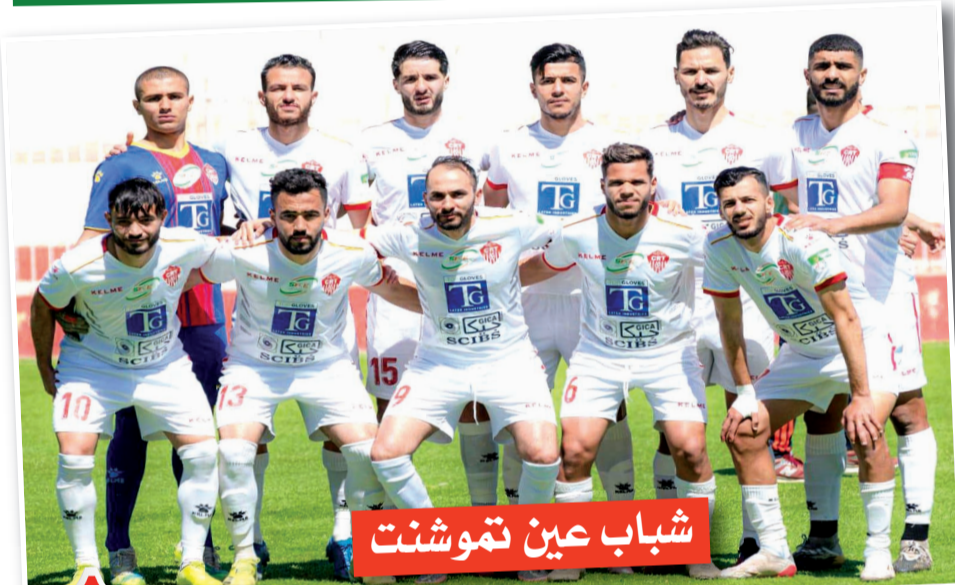
شباب عين تموشنت