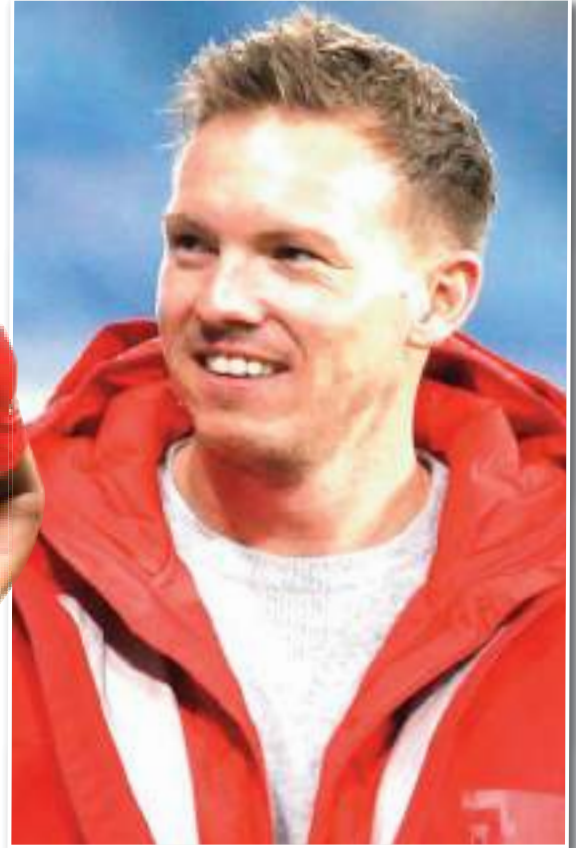
نادي بايرن ميونخ هذا الصيف إذا ترك المنتخب الألماني.

مدربين ألمان مرتبطين بتدريب برشلونة، إلى جانب توماس توخيل مدرب بايرن ميونخ الحالي، وهانسي فليك مدرب بايرن السابق الآخر، ولكن يبدو بأن البلاوجرانا يركزون جهودهم على إقناع تشافي بالبقاء في النادي أولاً وقبل كل شيء.