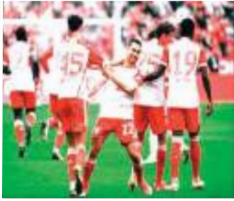
استعاد بايرن ميونخ نغمة الانتصارات، بعد الخسارة في آخر جولتين من البوندسليغا، بالتفوق على ضيفه كولن (2-0)، مساء يوم السبت، في المباراة التي احتضنها ملعب أليانز أرينا.