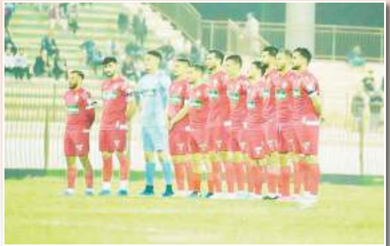
اللاعبون تجاوزوا مرحلة ما بعد إقصاء الكأس

يتواجد لاعبو مولودية وهران في حالة نفسية مرتفعة رغم الاقصاء الاخير من منافسة كأس الجمهورية أمام اتحاد بسكرة، حيث عرف المدرب بوزيدي كيف يخرج لاعبيه من مرحلة ما بعد الاقصاء الخيب، ويدخلهم في أجواء مباراة شبيبة القبائل والتي يأمل لاعبو الحمراوة للعودة منها بأفضل نتيجة ممكنة للمواصل في ديناميكية النتائج الإيجابية في البطولة.