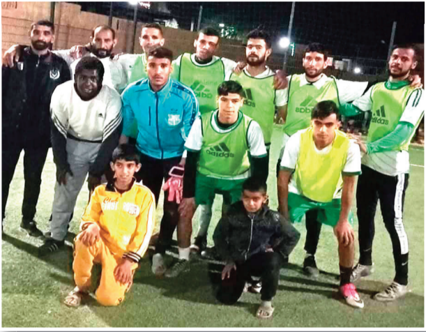
عالية ومهارات كروية متنوعة. لينتهي في الأخير بفوز فريق النور بنتيجة أربعة أهداف مقابل اثنين ويتم إنزال ستار الدورة الكروية الرضائية في أجواء جميلة كانت بمثابة إستثناء في المنطقة.