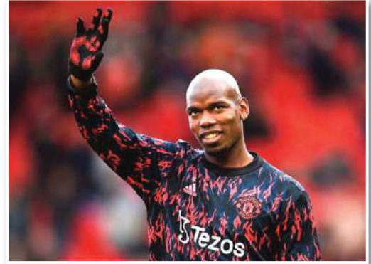
لمح الفرنسي بول بوغبا لاعب عطف وسط فريق يوفنتوس الإيطالي إلى إمكانية اللعب في الدوري الفرنسي بعد رحيله عن اليانكوتيري. وتعرض بول بوغبا لصدمة قوية

وكانت التقارير الصحفية قد أكدت توصيل يوفنتوس لاتفاق مع بول بوغبا على فسخ عقده بالتراضي، وبعدها سيكون حراً في الانتقال لأي فريق آخر. وسئل بول بوغبا عن مستقبله حسب صحيفة «ليكيب» الفرنسية، ورد قائلًا «لا أعرف ماذا سيحدث غداً». وأضاف «لما لا اللعب في الدوري الفرنسي؟ ليس علي أن أقول لا، سترى».