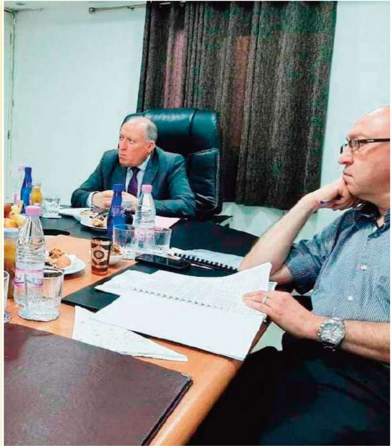
شبيبة الساورة والفريق ككل.

بحسب ما رقت عليه جريدة «بولا» منذ إستقالة الرئيس مامون حمليبي، فإن الجميع بمن فيهم لجنة الأنصار الجديدة، يرفضون بشكل قاطع تمديد مهمة اللجنة المؤقتة التي أشرفت على الفريق في الفترة الماضية، ويصرون على إحداث تغيير جذري وتنصيب إدارة شرعية جديدة