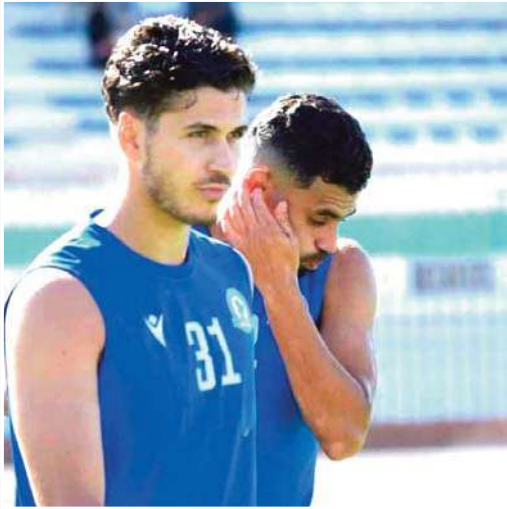
حصص الغد على أقصى تقدير.