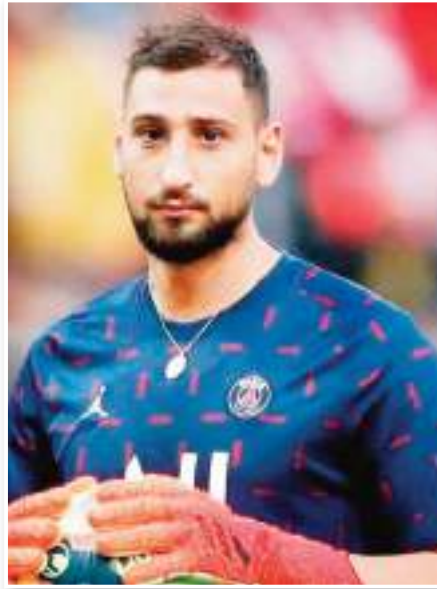
وتدع مشاعرك تظهر، لكن على أرض الملعب تحاول ألا تدع ذلك يؤثر عليك، لقد تطورت كثيراً في هذا الصدد".

اعترف جيانلويجي دوناروما، حارس باريس سان جيرمان، بأن العودة للملعب سان سيرو لمواجهة فريقه السابق ميلان، لم تكن سهلة، يجي غادر صفوف ميلان بعد نهاية عقده ليضم إلى باريس سان جيرمان في صيف 2021 بشكل مجاني، وهو الأمر الذي أثار غضب ميلان وجماهيره ومنذ انتقاله لباريس، عاد دوناروما للملعب سان سيرو خلال مباراة منتخب بلاده الإيطالي أمام إسبانيا في أكتوبر 2021، بينما واجه ميلان لأول مرة الثلاثاء الماضي في دوري أبطال أوروبا أمام جماهير الروسي، وتلقى الحارس استقبالا عذائياً حيث أطلقت الجماهير صافرات الاستهجان ضده، كما ألفت أملاً مزيفة تحمل اسم "دولاروما" عليه أثناء المباراة، وقال دوناروما في تصريحات أبرزها موقع "فوتبول إيطاليا": "لم يكن الأمر سهلاً في أكتوبر 2021 (مع المنتخب) ولم يكن سهلاً الآن أيضاً" وأضاف: "أنت تحاول ألا يتشتت انبياك على أرض الملعب، وتقدم كل ما في وسعك لمساعدة فريقك" وأتم: "بعد المباراة، تميل إلى الشعور بالأمر أكثر،