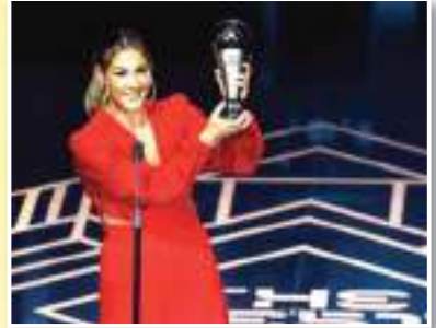
أقيم في العاصمة البريطانية لندن، حفل توزيع جوائز الأفضل لعام 2023، والذي ينظمه الاتحاد الدولي لكرة القدم (فيفا)، حيث شهد الحفل فوز

الهدف الفائز اللاعب البرازيلي وليام مادروغا. تم التصويت من قبل 91 ألف من المشجعين، على 11 هدفا.