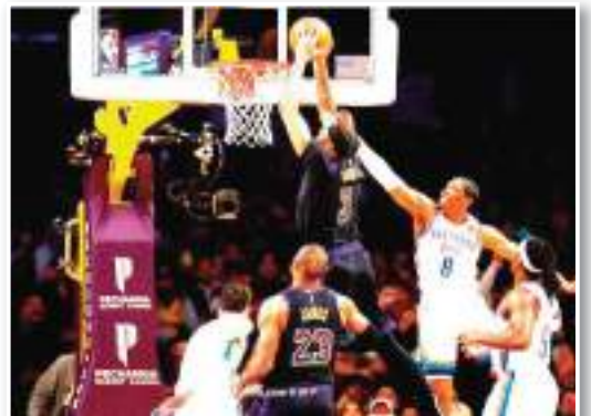
وفاز ليكرز على تاندر (112-105)، في المباراة التي أقيمت بينهما صباح يوم الثلاثاء. وشهدت المباراة ثالث أنوني ديفيز، الذي أحرز

27 نقطة وقام بـ15 متابع تحت السلة لمصلحة ليكرز، فيما سجل زميله ليريون جيمس 25 نقطة، ليقودا فريقهما لإنهاء سلسلة انتصارات تاندر، التي استمرت في مبارياته الأربع الأخيرة بالمسابقة. وأصبح هذا هو الانتصار السادس الذي يحققه لوس أنجلوس ليكرز في مبارياته الـ18 الأخيرة بالبطولة، من بينها فوزين على أو كلاهما سبتي تاندر. وأسفرت باقي المباريات التي أقيمت اليوم عن فوز ممفيس جريزليس على ضيفه جولدن ستيت واريورز (116-107)، وكليفاند كافالييرز على ضيفه شيكاغو بولز بنتيجة (109-91)، وبوسطن سلتيكس على ضيفه تورنتو رابتورز (105-96). كما اقتنع ميامي هيت، فورا صعباً من ملعب مضيفه بروكلين نتنس (96-95)، بعد اللجوء للوقت الإضافي، فيما انتصر يوتا جاز على ضيفه إنديانا بيسرز بنتيجة (132-105).