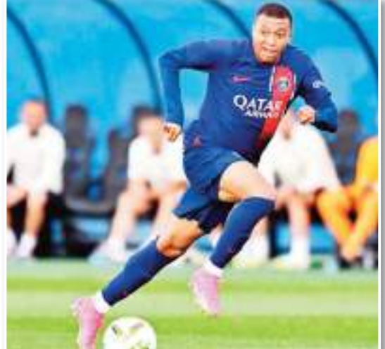
ذكرت صحيفة "الكيب" الفرنسية أن ريال مدريد الإسباني يستعجل كيليان مبابي نجم باريس سان جيرمان الفرنسي حسم قراره النهائي، حيث أن النادي سيؤمن نفسه هذه المرة من غدر مبابي حال

وأوضحت الصحيفة أن كيليان مبابي سيحصل على عرض من ريال مدريد سيتطلب منه "ضمانات مكتوبة" في حالة الرد بالإيجاب. وأكملت الصحيفة أن موافقة مبابي الشفهية على الانتقال إلى ريال مدريد ستكون على شكل ضمانات مكتوبة حتى لا يتكرر سيناريو ما حدث في عام 2022 الذي غير فيه مبابي رأيه بشكل صادم وقام بتמידد عقده مع باريس. وتعتقد صحيفة "الكيب" أن كيليان مبابي قريباً من الرحيل عن باريس سان جيرمان، وأن قراره النهائي قد يأتي في فبراير أو مارس المقبل.