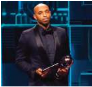
بتصويت مجموعة من الإعلاميين من كل دول العالم، ثم يتم تجميع كل الأصوات بالنسب المحددة من الاتحاد الدولي لاختيار أعلى ثلاث ومن ثم الإعلان عن الفائز في حفل الجائزة.

فوتبول» في تقديم جائزة الكرة الذهبية، ليحققها كريستيانو رونالدو في أول نسخة. وفي العالم الماضي، 2022، حصل الأرجنتيني ليونيل ميسي نجم إنتر ميامي الأمريكي على جائزة أفضل