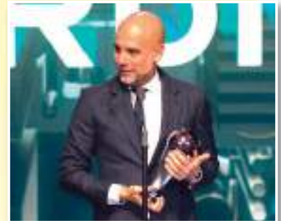
النجم الأرجنتيني ليونيل ميسي بجائزة أفضل لاعب، والتي عبرت مفاجئة، نظرا لترشيح نجم مانشستر سيتي إيرلينج هالاند بقوة للجائزة، كما فاز مدرب مانشستر سيتي بيب غوارديولا بجائزة أفضل مدرب. فيما يلي النتائج الكاملة للجوائز، ولقطات للفائزين بالحفل.