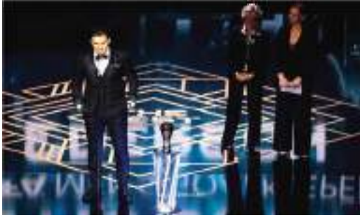
لاعب في العالم، كما فازت نجمة برشلونة ألكسيا بوتياس بالجائزة ذاتها في الفئة النسائية.