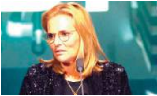
ومن المقرر أن يتم توزيع 7 جوائز في حفل الأفضل مساء اليوم الإثنين، بواقع أفضل لاعب (رجال - سيدات)، أفضل حارس مرمى (رجال - سيدات)، أفضل مدرب (رجال - سيدات)، بجانب جائزة بوشكاش لأفضل هدف. ويتنافس على الجائزة الأبرز (أفضل لاعب) كل من ليونيل ميسي وكيليان مبابي وإيرلينج هالاند.