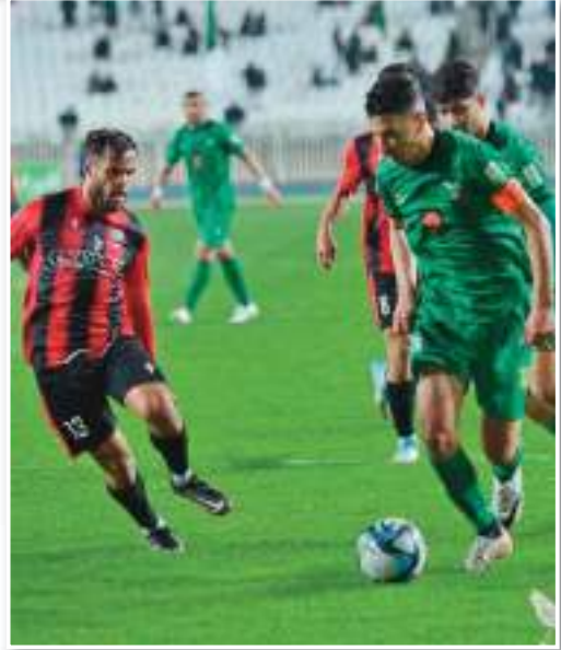
تستكمل أمسية اليوم مباريات الجولة السابعة عشر من الرابطة المحترفة الأولى التي ستعرف الجزائر صيفه شباب قسنطينة بملعب خمسة