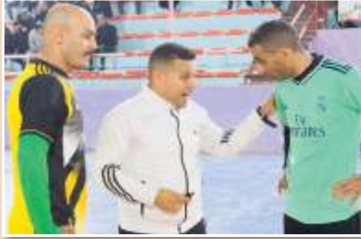
الرياضية العالية في مبادرة استقطبت أنظار عشاق الرياضة بالمنطقة في سهرات رمضان رائعة.

يبقى خيريا بالدرجة الأولى، من جانب آخر فمع مرور الجولات يتزايد الحضور الجماهيري بالقاعة التي باتت تستقطب عشاق كرة القدم في السهرة. و بما أنها الدورة الوحيدة بولاية غليزان التي تجرى في السهرة، فإن ذلك جعلها تستقطب العديد من المتفرجين خصوصا وأن برمجة المباريات بعد صلاة التراويح مباشرة يسمح للجميع بالالتحاق بقاعة نجمة بن عودة، كما أن القائمين على الدورة فضلوا برمجة مواجهتين في السهرة حتى يكون الإختتام قبل عيد الفطر وهو الأمر ذاته بالنسبة لدورة الرمان التي عرفت هذه السنة مشاركة 32 فريقا من مختلف أحياء وبلديات غليزان.