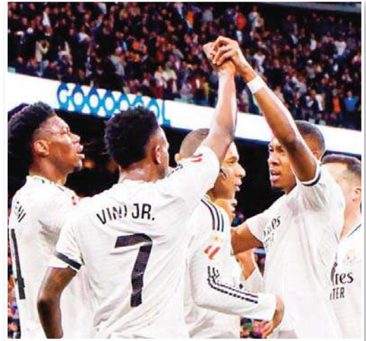
شهدت الدقائق الأخيرة من مواجهة ريال مدريد أمام فياريال لحظة أثارت الجدل، غضبه من زميله. وكان مبابي في وضعية

مخالفة داخل منطقة الجزاء دون أي رقابة دفاعية، منتظرا تفريرة من زميله أودا جولي. إلا أن اللاعب التركي فضل التسديد، لتصر الكرة أعلى المرمى، ما أثار انفعال المهاجم الفرنسي، الذي كان يسعى لتسجيل هدفه الثالث في اللقاء "هاتريك". ورددت الكاميرات اعتراض مبابي على قرار زميله، حيث أشار بوضوح إلى المساحة التي كان يتمركز فيها، معبرا عن استيائه من ضياع فرصة هدف محقق. يذكر أن مبابي تألق في اللقاء وسجل هدفين، في اللقاء الذي انتهى (1-2)، ليرفع ريال مدريد رصيده إلى 60 نقطة في صدارة ترتيب الليغا. فيما تجمد رصيده فياريال عند 44 نقطة في المركز الخامس.