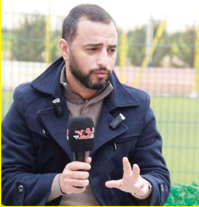
كيف تعمل الرابطة الولائية على تطوير الطب الرياضي في وهران؟

«الرابطة تولي أهمية كبيرة للطب الرياضي، لأنه أصبح جزءاً لا يتجزأ من كرة القدم الحديثة. نحن نعمل على تقديم استشارات طبية للأندية، ومراقبة الحالة الصحية للاعبين، خاصة فيما يتعلق بالإصابات، التغذية، والوقاية من الإرهاق. كما أننا نسعى لتنظيم دورات تكوينية للمدربين حول الإسعافات الأولية والإعداد البدني. التطوير الطبي في الرياضة ضروري لضمان أداء أفضل وحماية اللاعبين من الإصابات طويلة الأمد.»