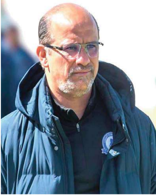
حاليا، كما أن كل العناصر المصابة إسترجعت إمكانياتها البدنية وهذا يحسب له كذلك.