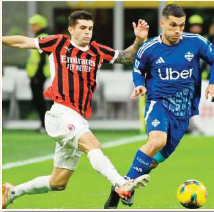
قلب ميلان الطاولة على ضيفه كومو، وحول تأخره إلى فوز (1-2) على ملعب سان سيرو، يوم السبت.