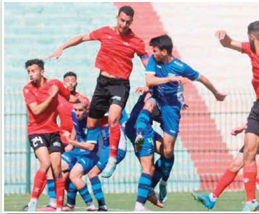
معززة حظوظ البقاء، ونفس الشيء لغالي مينا متقدما خطوة إضافية بعيدا عن شيخ النزول، معسكر الذي استثمر في وضعية سريع

انتهت الجولة الـ 25 من عمر القسم الثاني هواة عن مجموعة وسط غرب على وقع تسجيل 16 هدفا في كل المباريات، كما تمكن فريقان فقط من العودة بالزاد كاملا خارج القواعد، والبداية ستكون بالقمة المشرفة التي جمعت بين نجم بن عكنون المصنود، وصيفه شيبية تيارت وانتهت بالتعادل بهدف لمتله في ضيافة الزرقا، حيث تمكن النجم من ادراك التعادل في وقت قاتل محافظا بذلك على عرشه، ويقتي المستفيد الأكبر والوحيد من هذه الجولة هو فريق ترجي مستغانم، هذا الأخير لم يفوت فرصة استقباله للغريق وداد تلمسان و ينتصر عليه بثنائية نظيفة وضعت الحوارة على انفراد في المركز الثاني و يفارق نقطة عن نجم بن عكنون، ليحيي الترتيب آماله و بقوة في لعب ورقة الصعود، وبالنسبة لشباب المشرفة فقد أضعوا الكثير من حظوظهم في المنافسة على الورقة الوحيدة المؤدية للمحترف الأول، حين تعادلوا في ضيافة نصر حسين داي بهدفين لمثلهما، واستفانقت الصادة أخيرا وأسقطت مستقبل واد سلمي بهدفين لواحد