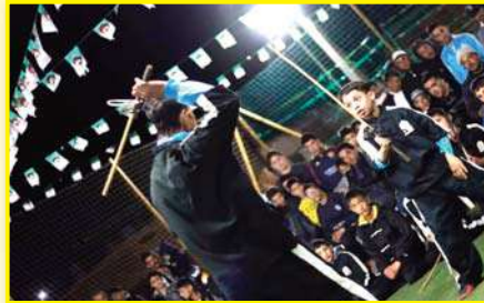
هذا وتابع المهرجان الولائي كل من نواب المجلس الشعبي

هذا وكانت المشاركة مميزة وبحضور نوادي وجمعيات محلية في صورة النادي الرياضي لرياضة العصا الخمدية، النادي الرياضي النور للصا التقليدية غريس، فرع رياضة العصا بوحنيقية، فرع رياضة العصا