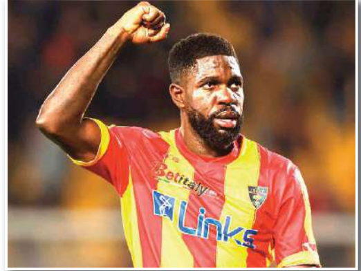
اقرب إنتر ميلان من تقديم خدمة جلييلة لبرشلونة في المراكز الصيفية المقبلة. ويواجه البارسا أزمة مالية كبيرة تجره على بيع العديد من اللاعبين خفض الرواتب أو تحقيق دخل.

كي يهرب من قيود قانون اللعب المالي النظيف. ووفقا لصحيفة "سبورت" الإسبانية، يخطط إنتر لضرب الفرنسي صامويل أومتيتي، مدافع برشلونة المعار إلى ليتشي، في الصيف المقبل. ويقدم أومتيتي مستوى جيدا أثناء فترة الإعارة في الدوري الإيطالي. وكان مسؤولو إنتر وبرشلونة اجتمعوا لمناقشة العديد من الصفقات، الخميس الماضي، في النادي الكالوني. وسبق أن فشل برشلونة في بيع أومتيتي في الصيف الماضي، وذكرت تقارير إسبانية أن المدافع الفرنسي لا يزال خارج حسابات تشافي هيرنانديز، المدير الفني. ويعلم البارسا بالتخلص من أومتيتي لتحقيق مكاسب اقتصادية وتسهيل عودة ليونيل ميسي وإبرام شفقات أخرى. ومن المقرر أن يخسر إنتر خدمات ميلان سكرينيار في الصيف المقبل، بعد أن أعلن اللاعب توقيعه مع باريس سان جيرمان، لذا يبحث الترتوري عن مدافع جديد.